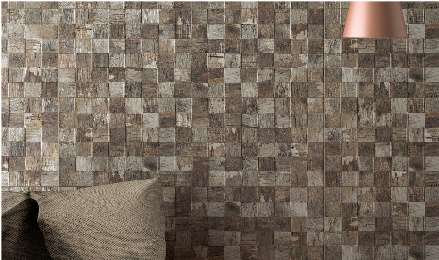
DÉCOR GRIS/BRUN 3D